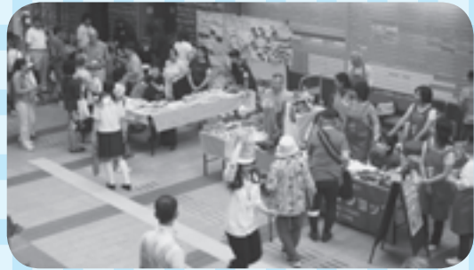
第10回多摩ふれあいまつりの様子