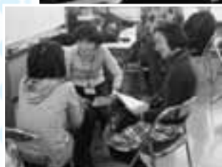
お話相手（傾聴）ボランティア入門講座の様子