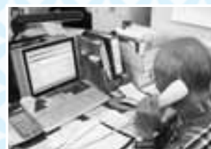
事務ボランティアの活動の様子

人とかかわることは好きだけど運転に自信がない…、コーディネートの手伝いなら…、そのような方、是非ご協力をお願いします！