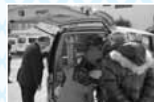
運転ボランティア養成講座の様子

高齢や障害により公共交通機関を利用することが困難な方が、地域で孤立することを防ぐために、自家用車や福祉車両を使用した移動の支援を行うボランティアです。