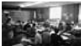
いこいの家の様子