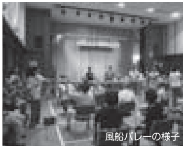
風船バレーの様子

来年には、本交流会も第10回の記念すべき節目を迎えます。参加者・応援者の皆さん、元気でまたお会いしましょう!