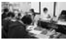
福祉団体での活動の様子

多摩区の地域福祉活動に多くのご支援をいただき、誠にありがとうございました。平成21年度にお預かりした金品は、次のように活用させていただきました。