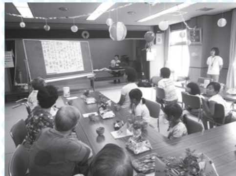
「チャレボラ2011」夏休み体験ボランティア講座