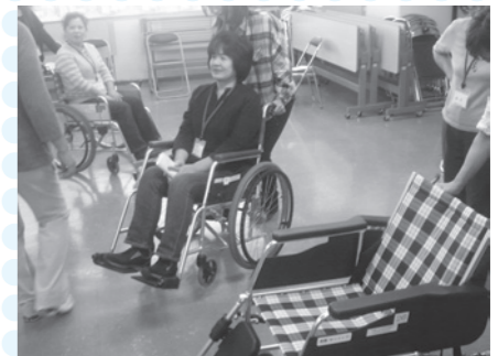
ボランティア入門講座(車イス体験)

また、各地区社会福祉協議会に対しては、同協議会における地域福祉事業の貴重な財源となっています、赤い羽根共同募金運動の仕組みについての研修会も開催しました。