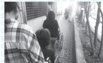
ボランティア入門講座(車イス体験)