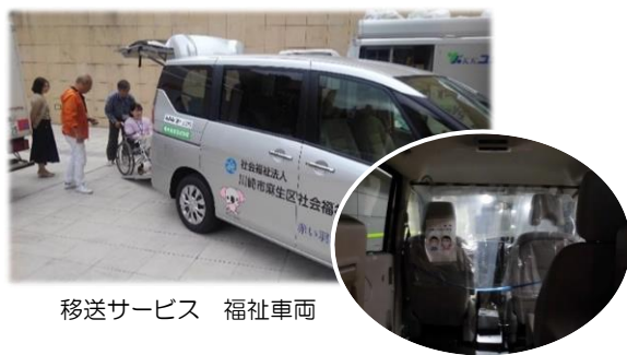
移送サービス 福祉車両

配布方法を変更し、区内の皆様へポスティングを利用して11月に広報紙「ほほえみ」をお届けいたしました。