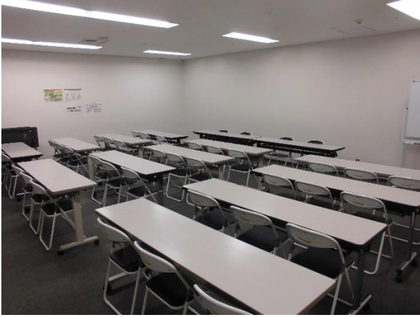
○大研修室 原形 教室形式 40名