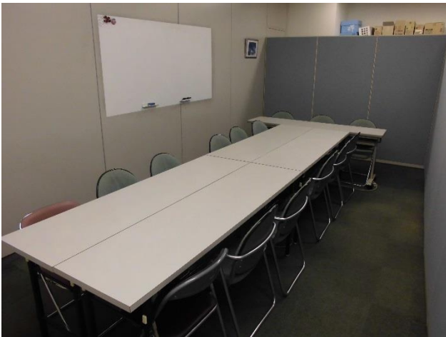
○小研修室 原形 島形式 15名

※当施設は防音設備を備えておりません。大きな音の発生する利用は他のテナントから苦情が寄せられますので、控えてください。