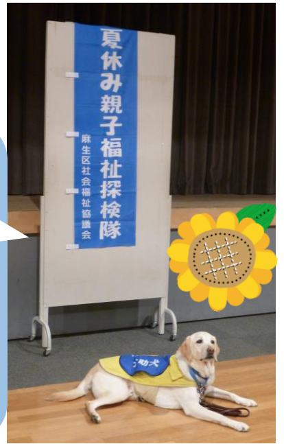
きくねんときて ビーアールけん ちゃろくん 昨年度来てくれたPR犬のチャロくん