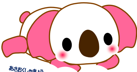
あさおくしゃきょう 麻生区社協キャラクター キューちゃん

しゃかいふくしほうじん かわさきしあさおくしゃかいふくしきょうぎかい 社会福祉法人 川崎市麻生区社会福祉協議会