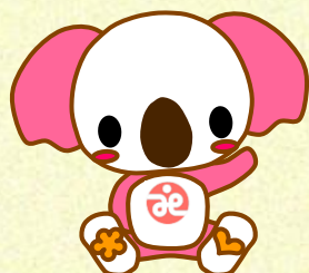
麻生区社会福祉協議会キャラクター キューちゃん