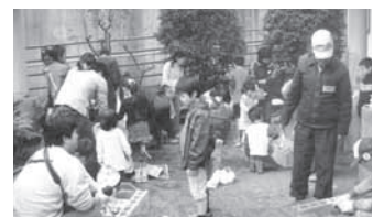
火おこしに悪戦苦闘