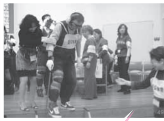
装着し、高齢者疑似体験に出発(市民館大会議室)